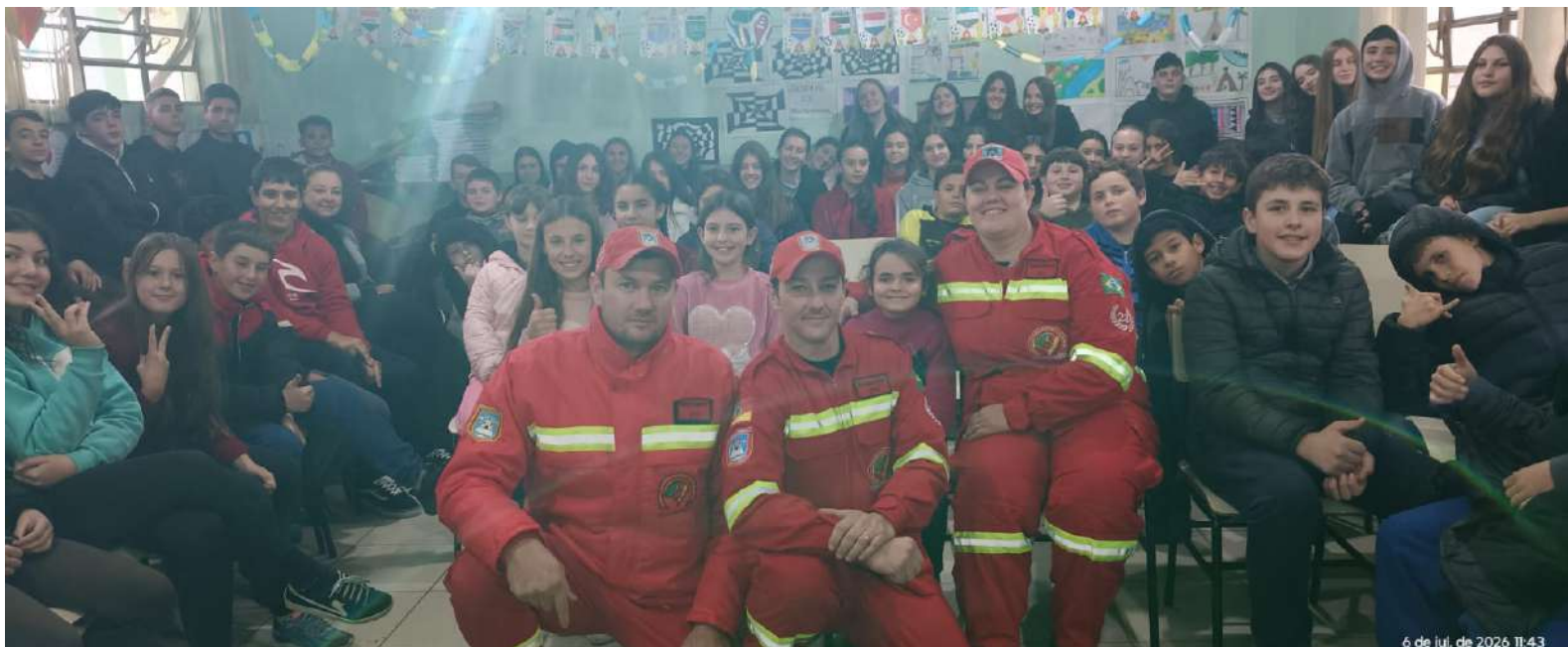
6 de jul. de 2026 11:43

Palestras em escolas municipais aproximam estudantes do trabalho dos socorristas e fortalecem a cultura da prevenção; associação celebra 19 anos de atuação em defesa da comunidade