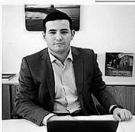
Raphael Ayub Secretário de Turismo do RS