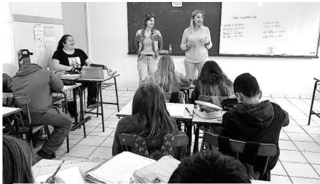
Atualmente o educandário possui 158 alunos da pré-escola ao 9º ano do Ensino Fundamental