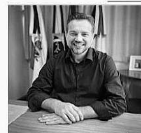
Jonas Calvi Prefeito de Encantado

Confirmar presença até o dia 22/08, pelos fones (51) 98031-7928 e (51) 3655-9092, ou pelo e-mail turismo@valeverde.rs.gov.br