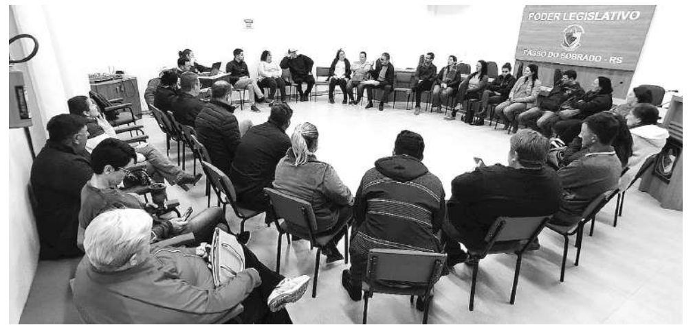
Membros do Conselho Municipal de Saúde estiveram reunidos, na última terça-feira, 2, na Câmara de Vereadores de Passo do Sobrado