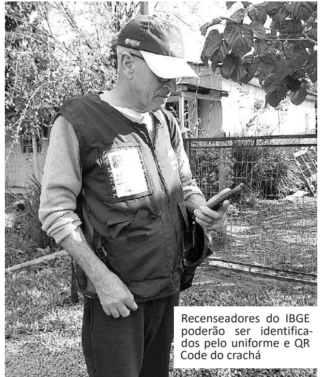
Recenseadores do IBGE poderão ser identificados pelo uniforme e QR Code do crachá