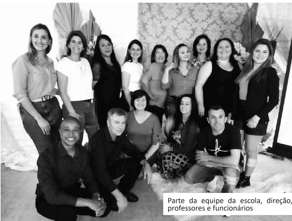
Parte da equipe da escola, direção, professores e funcionários